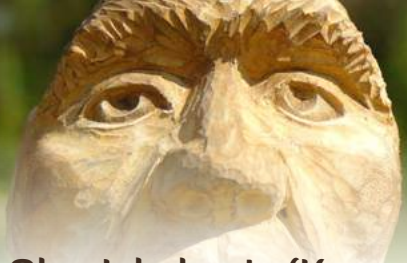
Oleg Jakobovic (Kazachstan)