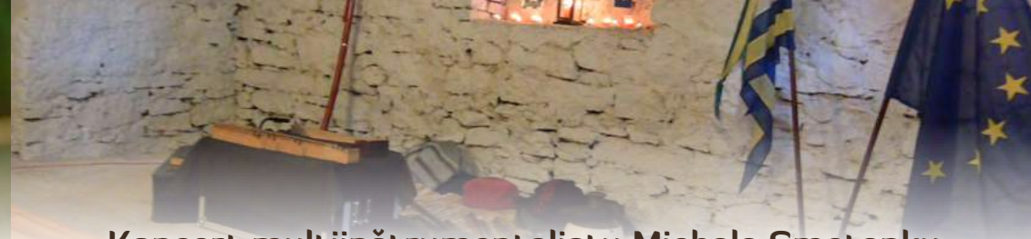
Koncert multiinštrumentalistu Michala Smetanku